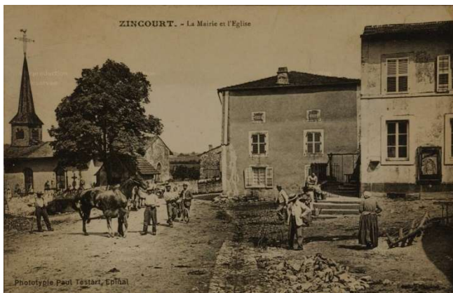
Arch. dép. Vosges, 4 Fi 544/1.