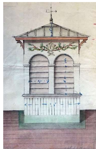
Arch. dép. Vosges, Edpt 170/1M1/2.

Autant de sujets que les élèves des 9 classes participantes ont traité au travers des 12 panneaux de cette exposition.